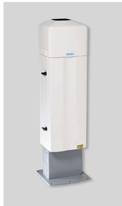
Облакомер CL31 фирмы Vaisala производит измерение высоты нижней границы облаков и вертикальной видимости при любой погоде – хорошей или плохой.

характеристики за счет поддержания окошка в сухом и чистом состоянии. В холодных условиях обогрев стекла исключает его заиндевание.